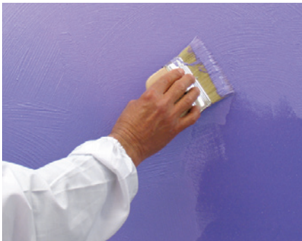
Shine seconda mano con pennello