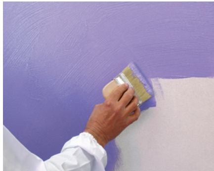
Shine prima mano con pennello