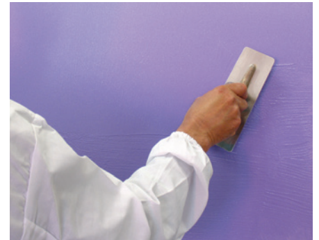
Shine lisciatura prima mano